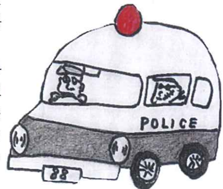
利用者さんの作品