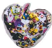
(デイケア たんぽぽ)