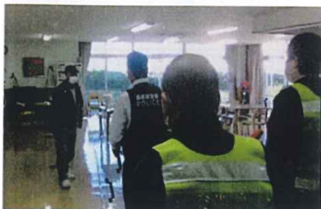
不審者対応訓練の様子①